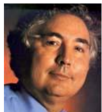
Мануэль Кастельс (1942)