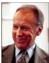
Пётр Штомпка (1944)