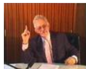
Иммануэль Валлерстайн (1930)