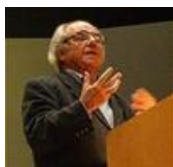
Жан Бодрийяр (1929-2008)