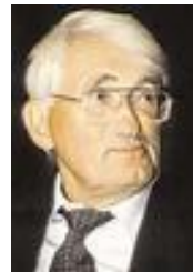
Юрген Хабермас (1929-19)