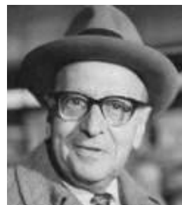
Макс Хоркхаймер (1895-1973)