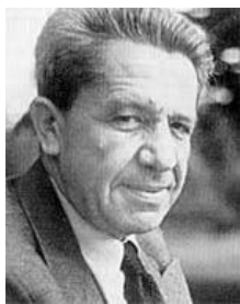
Альфред Шюц (1899-1959)