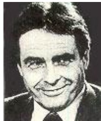
Пьер Бурдьё (1930-2002)