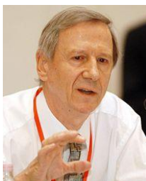
Энтони Гидденс (1938-2003)